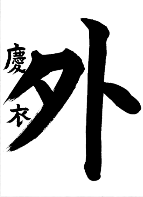
二年生 白沙 高柳 慶衣